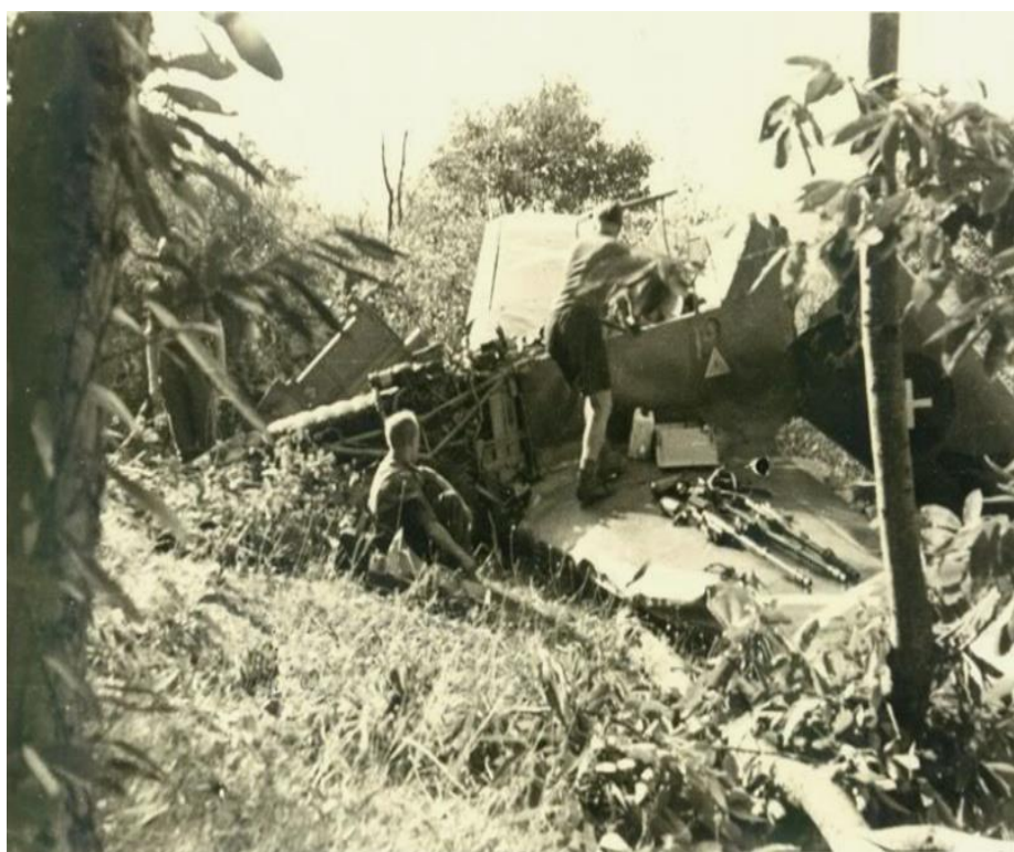
Ya han comenzado los trabajos de recuperación y le han sido extraídas las tres ametralladoras, detalle éste que permite identificar al avión como un BF.109B1, equipado con una tercera MG.17 que disparaba a través del buje de la hélice