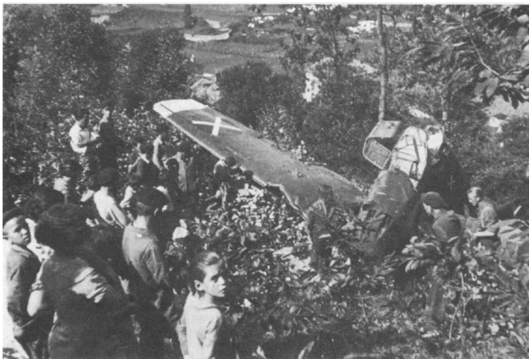
Bf.109 matrícula 6-43 retenido por la vegetación de la abrupta ladera que desciende hasta el pueblo de Cué, cuyas casas se entrevén en la imagen.