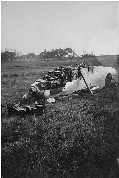
Otras tres imágenes del 6-12 que permiten apreciar los importantes daños sufridos en el aterrizaje.