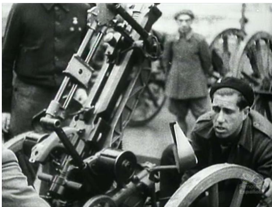
Ametralladora antiaérea republicana Oerlikon 1S de 20 mm sobre montaje JLaS

ametralladoras Oerlikon de 20 mm de “modelo anticuado” –algunas de ellas, al menos, Semag Tipo “L”-, 5 cañones automáticos dobles de 40 mm. Vickers; 3 cañones Vickers de 47 mm y 7 ametralladoras antiaéreas, sin más precisión, que supongo serían máquinas de infantería (20). De todas ellas llevó sólo dos Oerlikon al frente del Nalón que, al carecer de objetivos aéreos, se usaron contra las tropas de tierra enemigas hasta agotar las municiones. Hemos visto que, además, se ordenaba afectar dos compañías sobre camiones a la defensa contra aviones de los aeródromos, sin especificar modelo; aunque muy probablemente Oerlikon de 20 mm ya que los Vickers de 47/50 y doble de 40 mm eran de traslado y emplazamiento engorrosos, por tratarse de piezas navales.