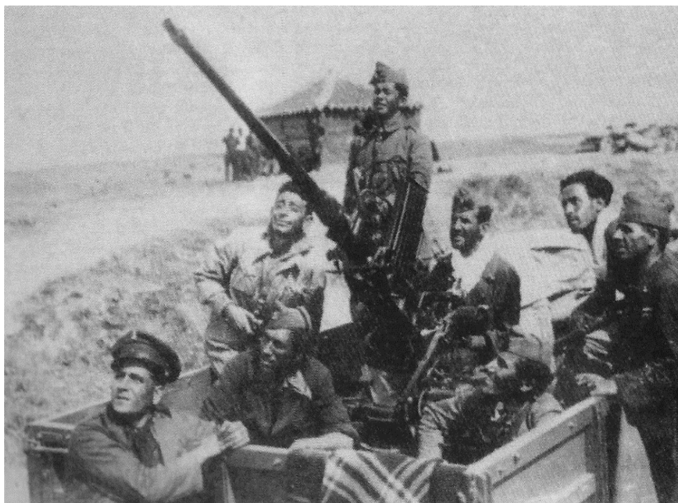
Ametralladora Oerlikon de 20 mm sobre camión.