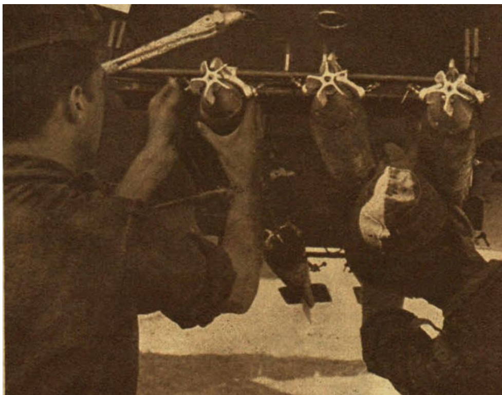
Armeros de Aviación completando en un Breguet XIX la carga ofensiva usada habitualmente sobre Asturias: seis bombas A.5, de 12 kilos, bajo cada uno de los planos inferiores en sus correspondientes lanzabombas 3-A-5