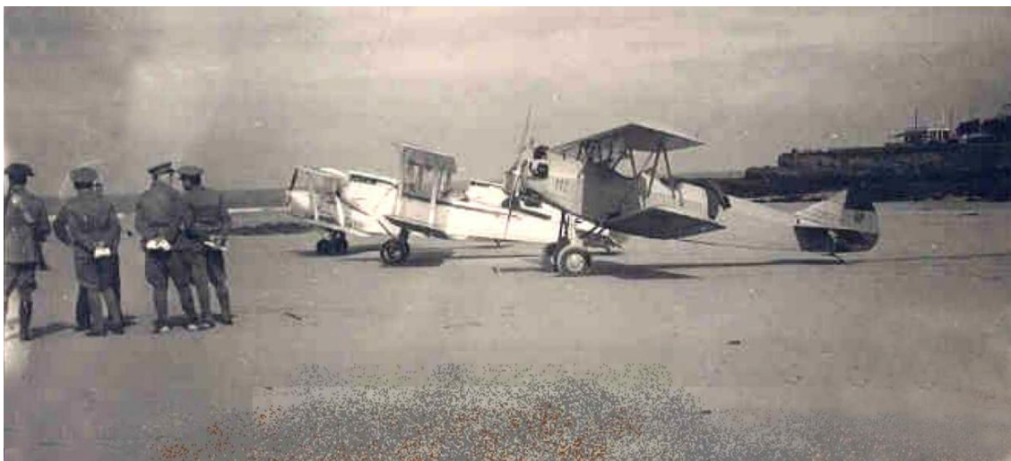
Avionetas aparcadas en la playa de Gijón. En primer término la Fleet 10, de la Aeronáutica Naval. Tras ella, una D.H.60 Metal Moth y una D.H.82 Tiger Moth de la Escuela de Vuelo y Combate de Alcalá de Henares.