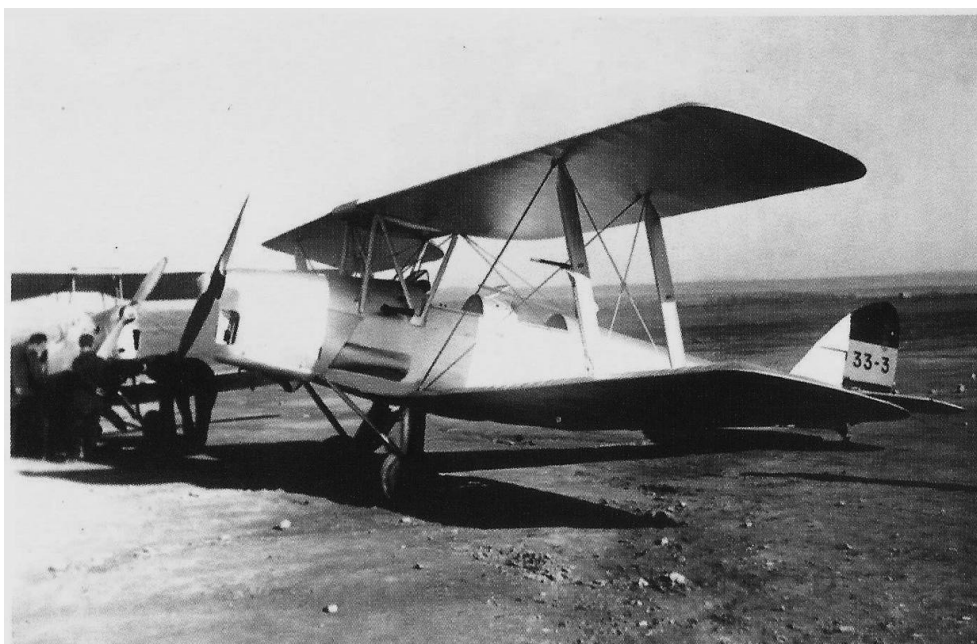
Dos de las DH.82 de la Escuela de Alcalá. En primer término, la 33-3.

fábrica 3148 y 3192 a 3195 que recibieron las matrículas militares 33-1 a 33-5. Todas ellas fueron destinadas a la citada Escuela de Alcalá y participarían en la campaña de Asturias junto con otra avioneta Fleet 10, adquirida por la Aeronáutica Naval igualmente en 1934. Las avionetas regresarían al día siguiente a Cuatro Vientos donde quedaban “en servicio de enlace con la zona de operaciones”.