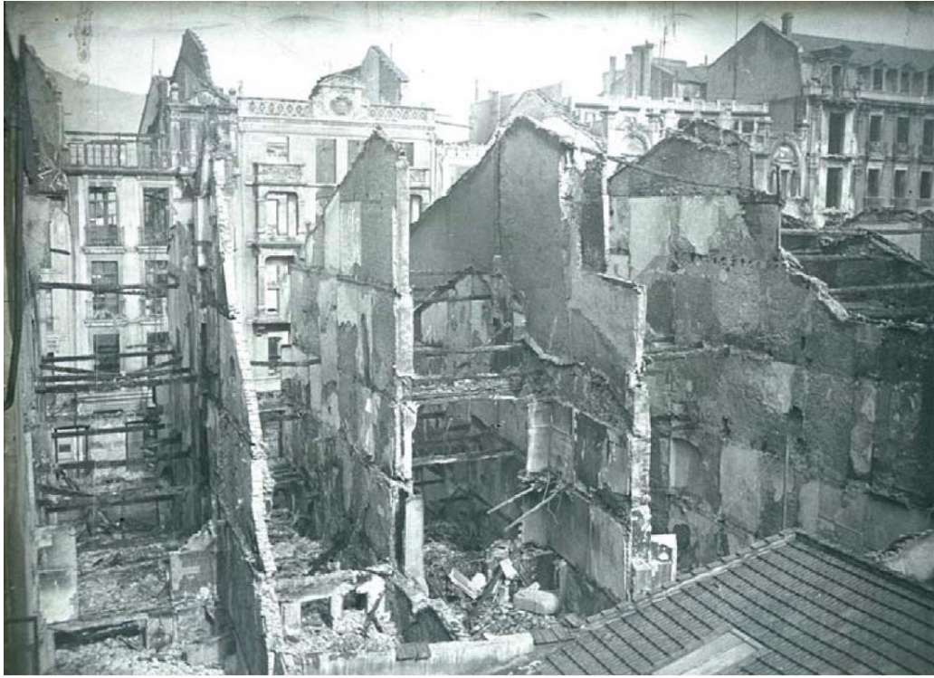
Estragos causados por el fuego en la calle San Francisco