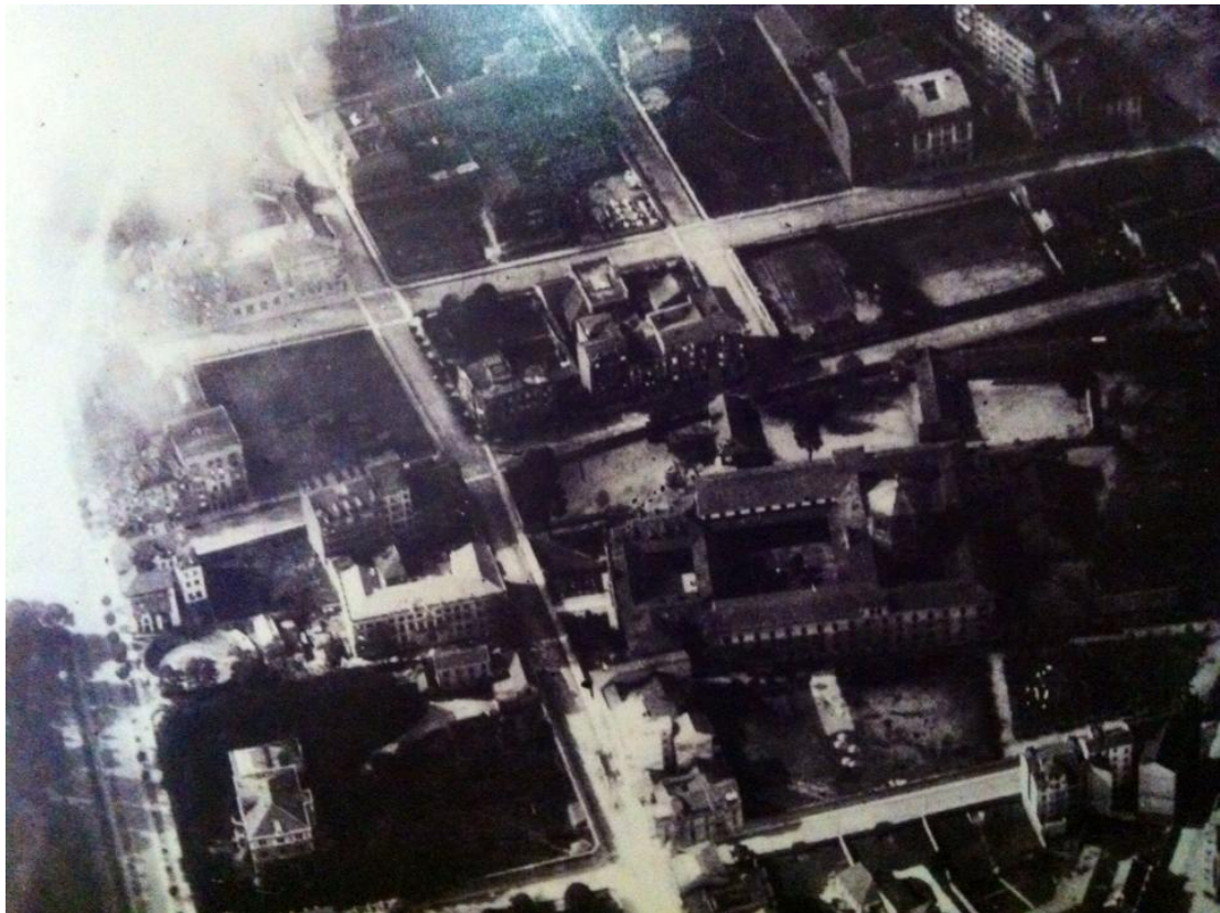
Incendios en la calle Conde de Toreno. En el centro de la imagen destaca el Hospicio; hoy Hotel Reconquista.