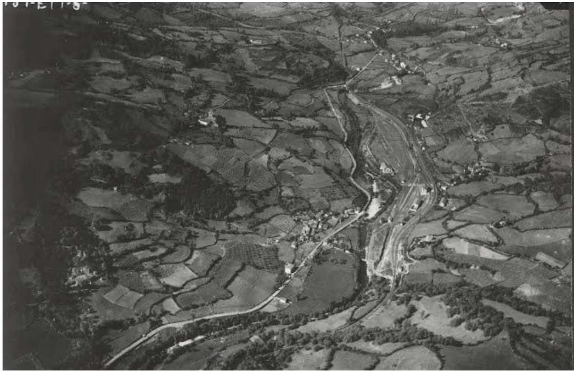
Vega del Rey, donde se hallaba atascada la columna Bosch, fotografiada por los aviones de León