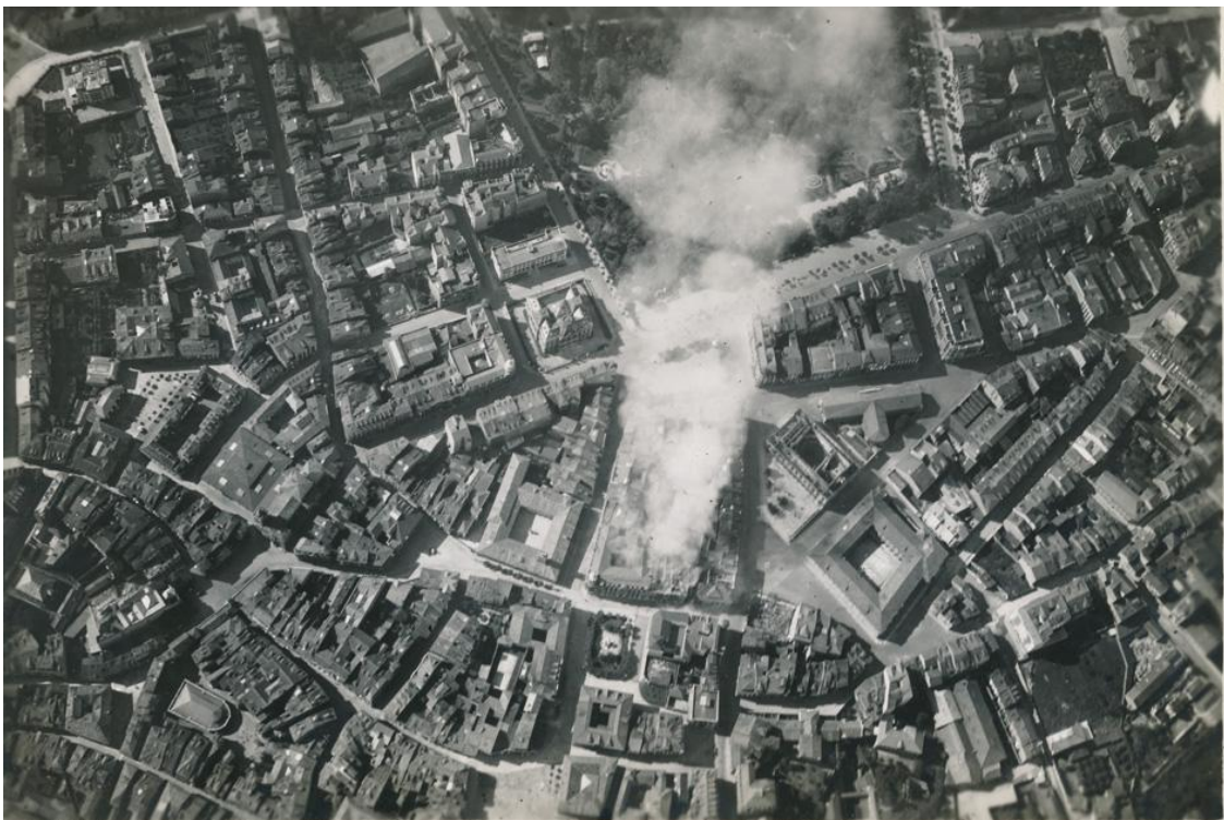
Los aviones de La Virgen del Camino fotografían los incendios provocados por los revolucionarios en Oviedo. En esta imagen vemos el que va consumiendo la manzana de casas entre las calles Argüelles y San Francisco.