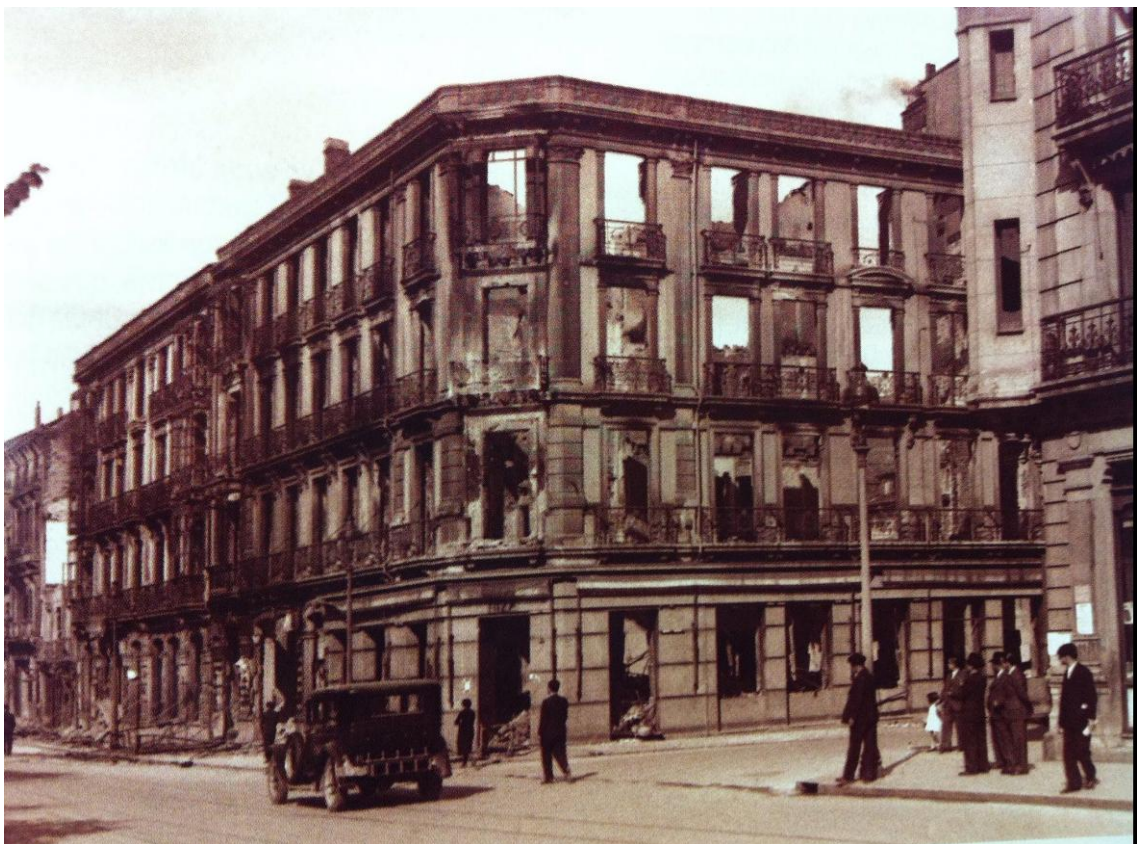
La calle Uría tras los incendios revolucionarios. Haciendo esquina con la calle Milicias Nacionales, el café Niza