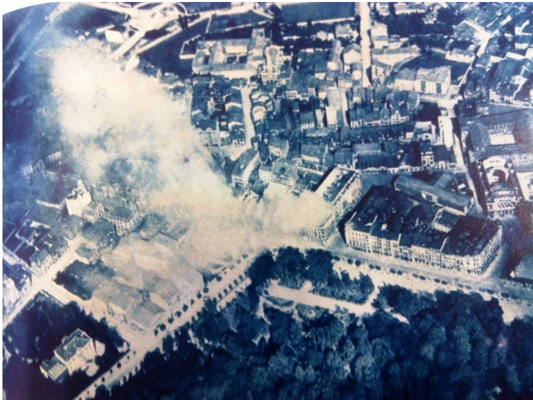
El fuego va devorando las casas de la calle Uría, a partir de la esquina con la calle Milicias Nacionales.