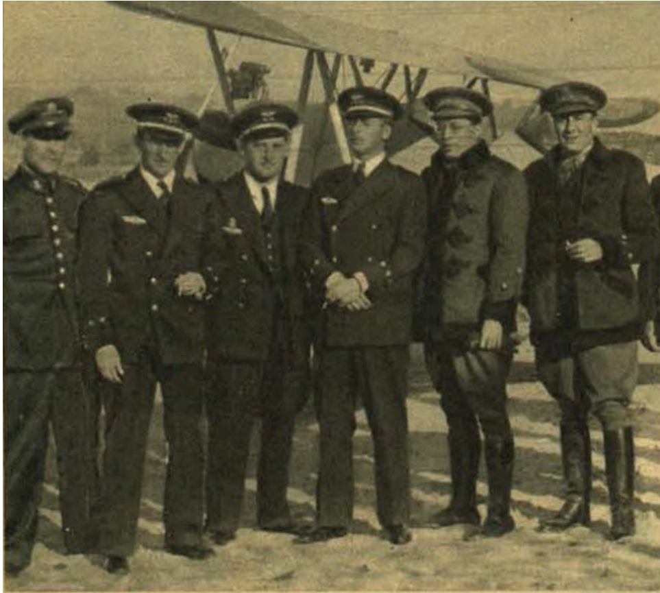
El equipo quirúrgico trasladado desde Valladolid posa en la playa de Gijón ante la avioneta Fleet 10 de la Aeronáutica Naval