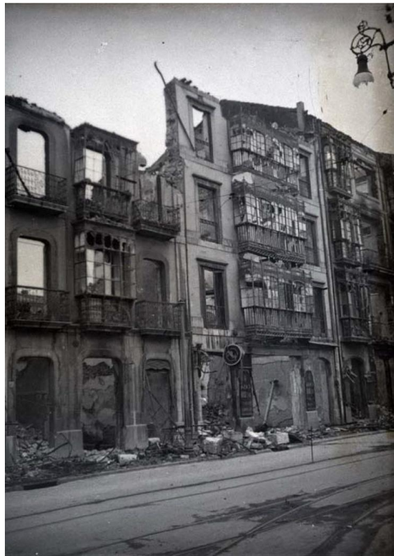
Aspecto de la calle Argüelles tras los incendios