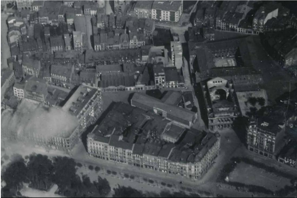
El mismo lugar de la foto anterior en llamas, fotografiado desde el aire.